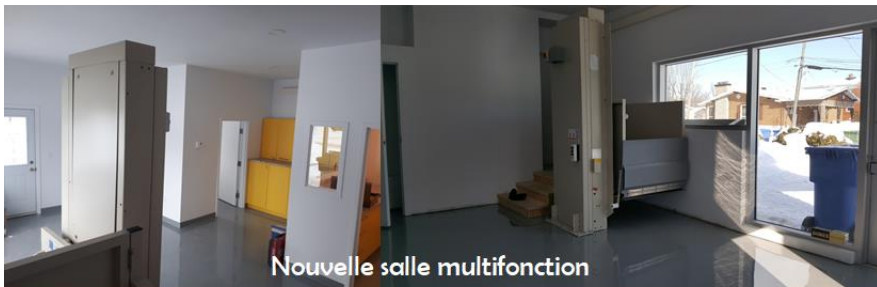
Salle de SPA transformée en salle multifonction