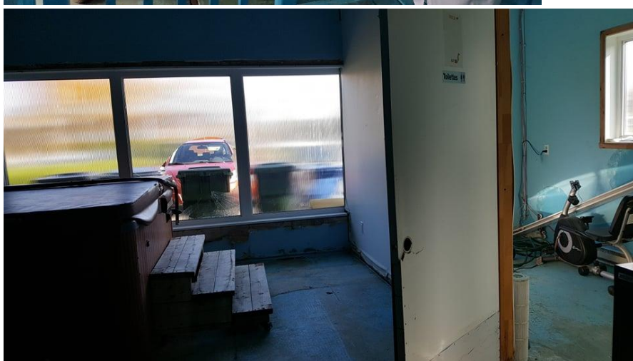
Salle de SPA avant les travaux