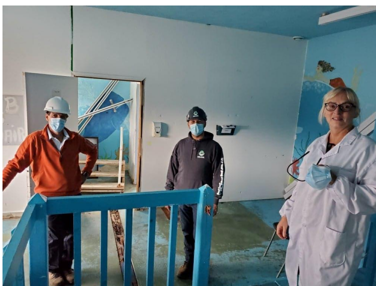
Premier octobre, début officiel des travaux

Au moment d'écrire ce rapport, l'ancienne salle de SPA a été convertie en nouvelle salle multifonction, et les travaux de finition extérieurs sont terminés.