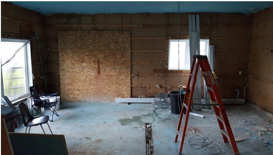
Salle de SPA au cours des travaux