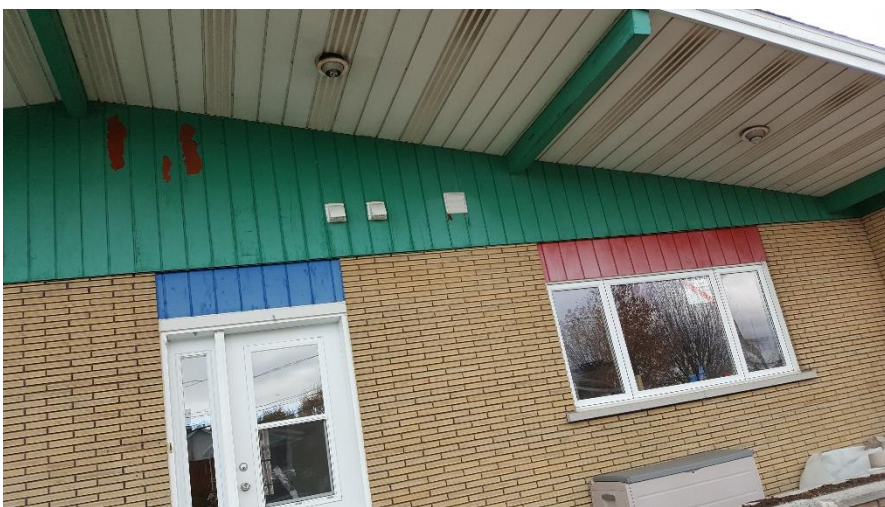
Extérieur avant les travaux, côté sur Sanctuaire