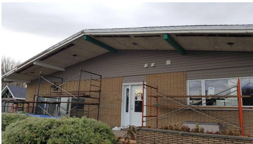
Travaux extérieurs en cours de réalisation

Le conseil d'administration et toute l'équipe la MGO sont enthousiastes par l'avancée des travaux et des résultats. Par la suite, la MGO bénéficiera d'une salle multifonction additionnelle avec entrée indépendante. Les services répondront plus facilement aux normes de sécurité en fermant certains accès.